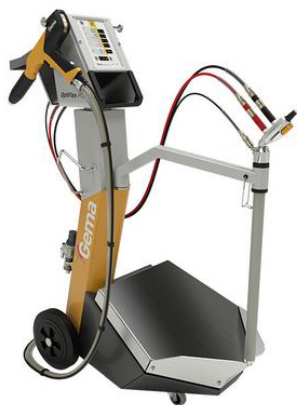
Optiflex Pro B®