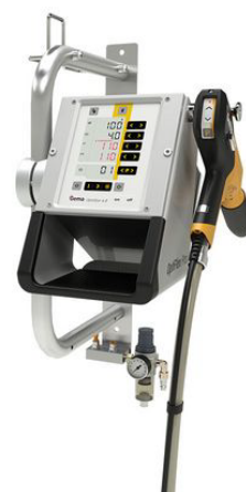
Optiflex Pro W®

Resultado? Qualidade de pintura perfeita e sempre com os mesmos resultados!