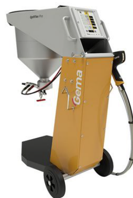
Optiflex Pro S®