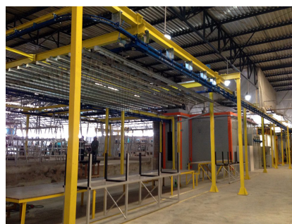
*Linha de pintura a pó