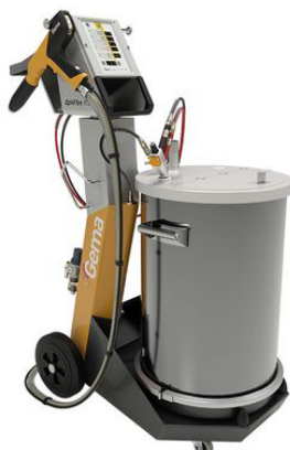
Optiflex Pro F®